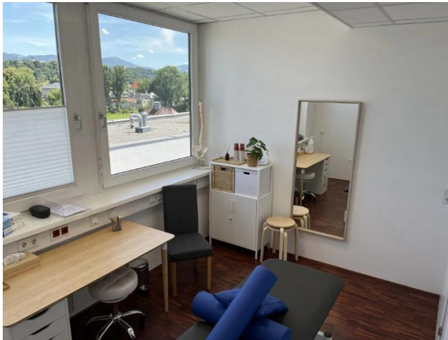
Behandlungsraum 2 (11m 2 )